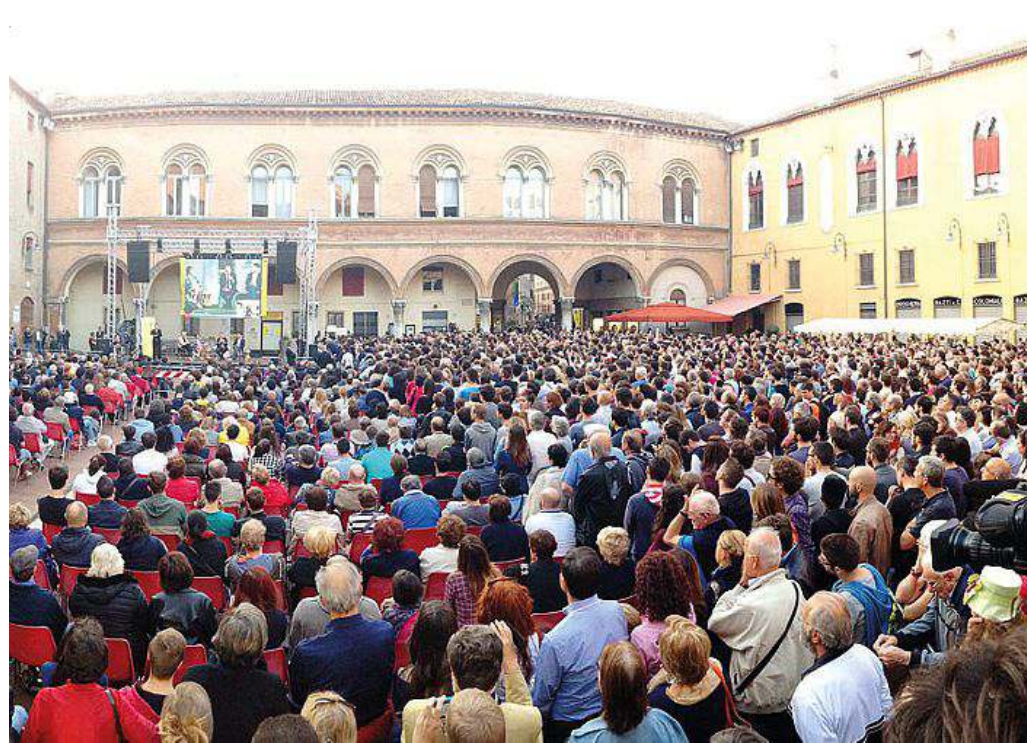
Piazza municipale gremita l'anno scorso in occasione dell'intervento del premier Renzi a Internazionale

Uno degli incontri già messi nero su bianco è in calendario per il 4 ottobre, giornata conclusiva del festival, quando a dialogare, stimolati dal direttore di RadioTre Marino Sinibaldi, saranno Adriano Sofri e Zerocalcare, il fumettista che sta sbandando tutto in questo ultimo anno, tanto che è stato finalista all'ultima edizione dello Strega con "Dimentica il mio nome". «Hanno quarant'anni di differenza ma, oltre alla distanza anagrafica, è difficile immaginare due persone più lontane e diverse di Adriano Sofri e Zerocalcare. Eppure hanno in comune