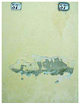
Ma Rea è alla prima personale

L'artista ferrarese inaugurerà la sua personale a fine mese