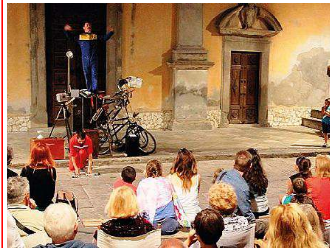
L'esibizione di Metà e Mavà a Rio nell'Elba per "ElbaBook"

La 9ª edizione del festival di Internazionale si svolgerà a Ferrara dal 2 al 4 ottobre. Il programma è tuttora in fase di definizione, visto che sarà ufficializzato solamente a settembre. In attesa di qualche arrivo a sorpresa (l'anno scorso ci fu quella del premier Matteo Renzi), di sicuro si prepara un'altra interessante edizione del festival, che lo scorso anno ha portato nella nostra città circa 71mila presenze. (f.t.)