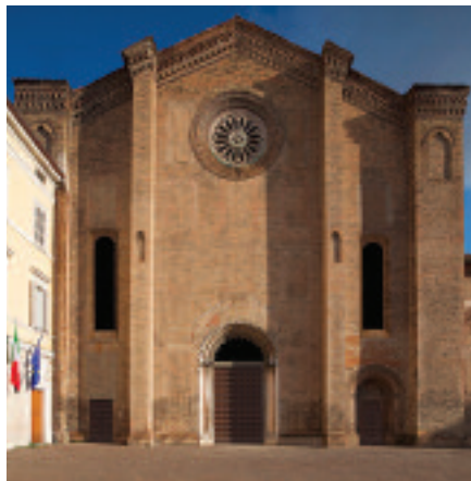
La facciata di San Francesco del Prato, dopo il certosino restauro

Le isole più belle dell'intero territorio sono le ex colonie penali, tra spiagge semi-deserte e paesaggi fuori dal comune. Dalla Toscana alla Sicilia, i penitenziari riconvertiti a luoghi di culto per viaggiatori curiosi, rispondono a nomi leggendari come Capraia, Pianosa, adibita nel 1858 a colonia penale dal Granducato di Toscana; Gorgona e Montecristo. Quest'ultima famosa grazie al romanzo di Dumas, Il conte di Montecristo , è accessibile solo per visite guidate organizzate, anche perché l'unico approdo dell'isola è Cala Maestra. In Sicilia, invece, ci sono Favignana, con il Forte di San Giacomo a forma di stella che ospitava il carcere, e l'ex colonia penale di Pantelleria. E ancora, Ponza e Ventotene nel Lazio, in Sardegna l'Asinara oggi parco naturale che ospita oltre 650 specie animali e dove si può circolare solo in bicicletta.