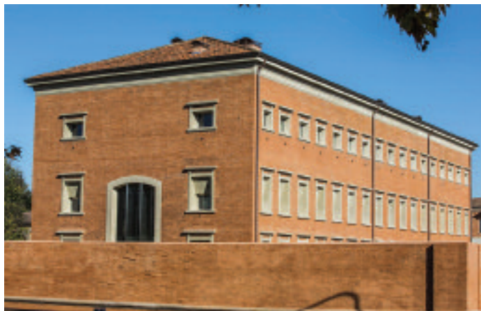
MEIS di Ferrara: nel 2020 i nuovi padiglioni a forma di pagine della Torah.

L'excurus nella nuova vita dei penitenziari continua con il Complesso monumentale carcere borbonico di Avellino , voluto da Ferdinando I d'Austria e costruito secondo i principi di umanizzazione della pena teorizzati da Bentham. Nel cuore della città, l'affascinante complesso esagonale con bracci a raggiera ospita oggi il polo culturale del capoluogo irpino, con ambienti museali, aree espositive, auditorium, sale per congressi, uffici, giardini, sale di consultazione, archivi, spazi per eventi e un laboratorio di restauro. I tre padiglioni a nord, una volta destinati alla detenzione maschile ospitano alcune delle sezioni del Museo Irpino , la Pinacoteca, il Lapidario, il Deposito visitabile, la sezione Risorgimento, Scientifica, ed il nuovo percorso espositivo Irpinia, Memoria ed Evoluzione, oltre a sale per congressi, spazi per mostre, per attività didattiche ed uffici. Negli stessi padiglioni si trovano anche il Catalogo della Soprintendenza Archeologia, Belle Arti e Paesaggio per le province di Salerno e Avellino e il CRBC Centro Regionale per i Beni Culturali della Campania. L'ex palazzina di comando, la tholos, il giardino e il padiglione ad ovest, ospitano gli uffici e il laboratorio di restauro della Soprintendenza Archeologia, Belle Arti e Paesaggio per le province di Salerno e Avellino. Il padiglione a est, quello destinato alla detenzione femminile, con ingresso su