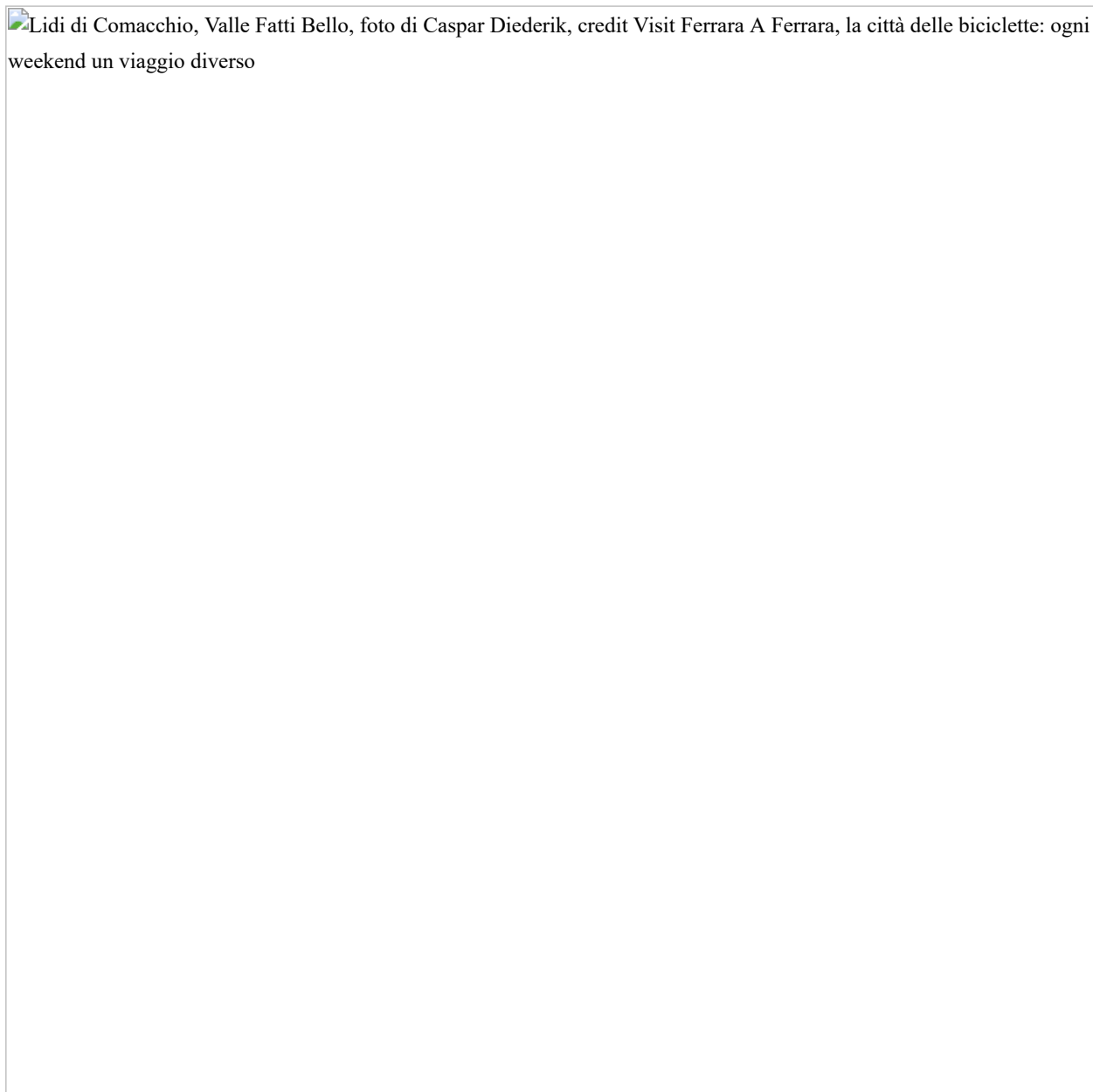
Lidi di Comacchio, Valle Fatti Bello