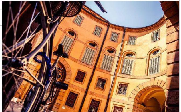
In alto da sinistra Palazzo dei Diamanti e la Rotonda Foschini. Accanto il Duomo