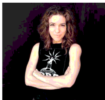
Ani Di Franco, cantautrice americana stasera in concerto a Ferrara Sotto le Stelle.